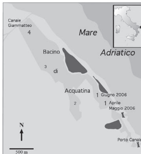
Fig. 1-Stazioni di campionamento nel bacino di Acquatina

La comunità ittica del bacino di Acquatina è stata campionata mensilmente da aprile 2006 ad aprile 2007. Per la cattura delle specie ittiche sono stati utilizzati i bertovelli collocati in 4 stazioni del bacino secondo un gradiente spaziale che comprendeva la parte antistante il canale principale di comunicazione con il mare fino alla parte più interna (Fig.1).